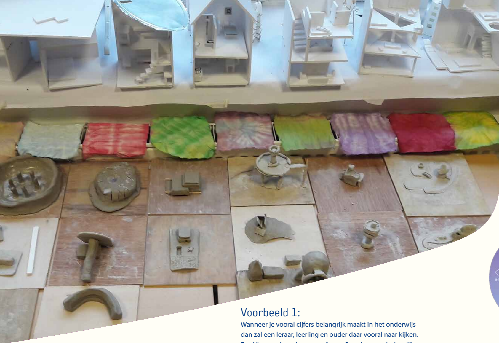
Werk van twaalfde klassers tijdens de architectuurperiode van de Adriaan Holst School in Bergen

In beide voorbeelden, rondom cijfers en afstandsonderwijs, kun je zien hoe belangrijk het is om steeds je af te vragen of het ontwerp dat we kiezen wel leidt tot het handelen dat in lijn is met onze intentie. Want cijfers zijn nooit een doel, de ontwikkeling van de leerling is het doel. Muziektheorie leren is niet het doel van muziekonderwijs. Het samen stilstaan en het stellen van de vraag of handelen congruent is met de intentie is dus van belang om waarde(n)vol onderwijs te kunnen bieden. Omdat dit proces geen lineair proces is, maar een continu proces zou je dit kunnen weergeven in een lemniscaat. Zie hieronder: